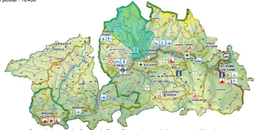
Carte de la zone des Raspès du Tarn. En vert émeraude la commune d'Ayssènes.